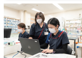
何気ない会話も大切に。地域に寄り添う温かな薬剤科の日常です