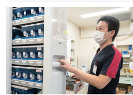
全自動錠剤分包機を活用し、精度の高い調剤体制を整えています