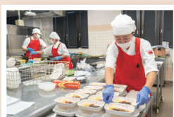
患者さんの笑顔を思い浮かべて調理しています！