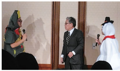
病院長と、取手市医師会忘年会実行委員会の大抽選会の様子

去る12月10日、柏クレストホテルで取手市医師会忘年会を開催しました。院内の部署間はもちろん、他の医療機関や、地域との連携の強化を目的に開催しているもので、コロナ禍で中止して以来、6年ぶりとなりました。ご来賓の方々にもご臨席いただき、日々のご協力への感謝の気持ちを込めての開催となりました。